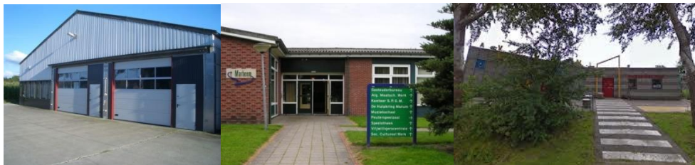
Depot en uitgiftepunt Grootegast

Uitgiftepunt Grootegast (+depot) Bovenweg 23B, 9861 GG Grootegast Uitgiftepunt Marum Mfc 't Marheem, Schoolstraat 8, 9363 BH Marum Uitgiftepunt Zuidhorn Avalon, van Starckenborghkanaal 1 ZZ, 9801TA Zuidhorn