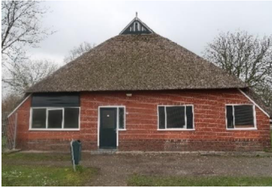
Uitgiftepunt Leek Rodenburg 1c, 9351 PV Leek