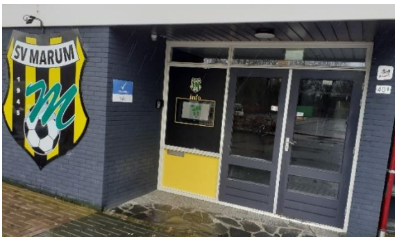
Uitgiftepunt Marum Kantine Sportvereniging Marum, Hoornweg 40b, Marum