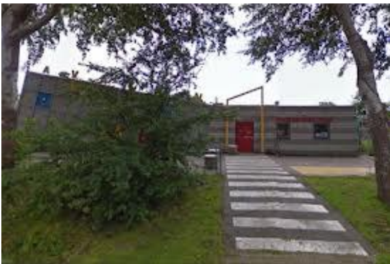
Uitgiftepunt Zuidhorn Kade Z, v. Starckenborghkanaal 1 ZZ, 9801TA Zuidhorn